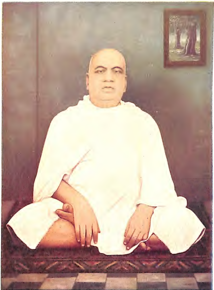
श्री पीताम्बरापीठाधीश्वराः परमपूज्य श्री स्वामीजी महाराज